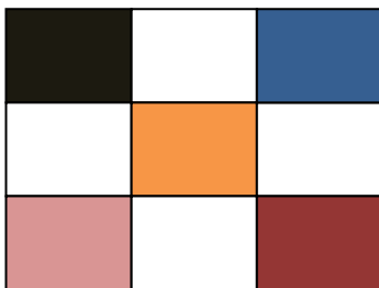
Komb 1 Komb 2 Komb 1

Sy dessa 2 olika kombinationer av remsor tillsammans